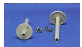
型號 (Type): M8B-106